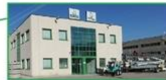
TECNOEDIL NOLEGGI S.R.L. Via Praga, 1 - Spini di Gardolo 38121 Trento (TN) Tel. 0461/990748