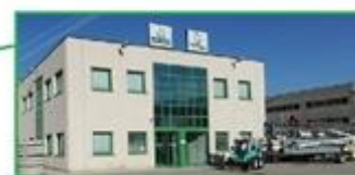
TECNOEDIL NOLEGGI S.R.L. Via Praga, 1 - Spini di Gardolo 38121 Trento (TN) Tel. 0461/990748