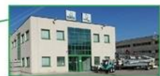
TECNOEDIL NOLEGGI S.R.L. Via Praga, 1 - Spini di Gardolo 38121 Trento (TN) Tel. 0461/990748