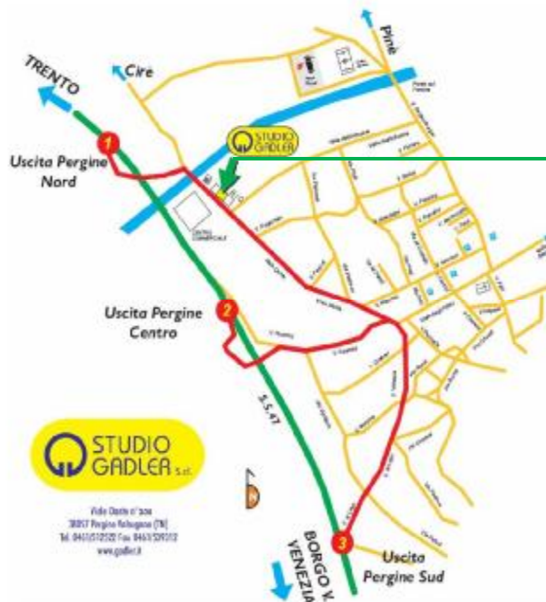
Studio Gadler S.r.l.

Restando a disposizione per ogni eventuale chiarimento, si coglie l'occasione per porgere distinti saluti.